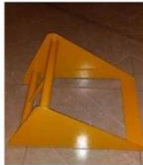
Tubo de 1"

Se tiene un estándar en cuanto a dimensiones y tipo de material siendo solo metálicas, sin excepción.