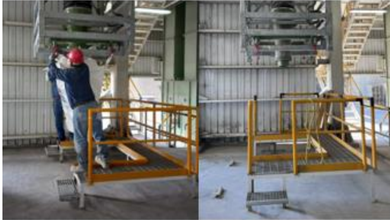
Antes (izquierda) y después (derecha) de modificación en plataforma y colocación de topes para montacargas.