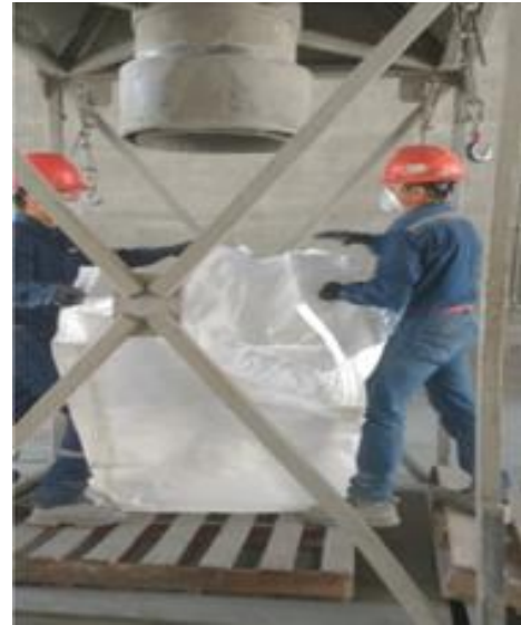
Posicionamiento para llenado de bolsa.

El envasado de cemento CPC 40 RS en presentación de Big Bag, es una actividad rutinaria en la cual el personal operador realiza carga manual y movimientos repetitivos en el acomodo de las tarimas, encontrando superficies inestables para poder desarrollar su trabajo, así mismo estar en interacción constante con el montacargas que traslada el producto, una vez concluida la actividad.