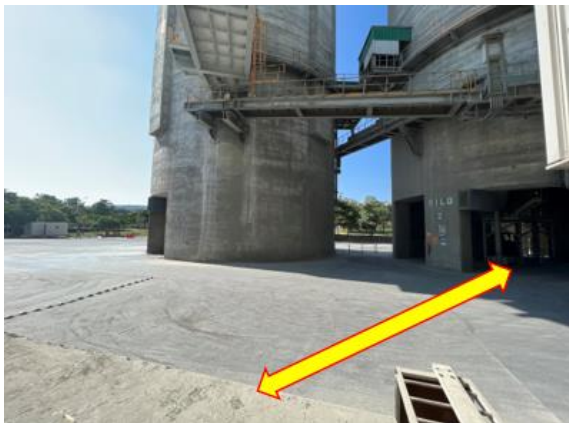
Trayecto de montacargas

El montacargas debe cruzar la zona de tránsito de tolvas para carga de producto a granel, incrementando riesgo de colisión si no existe una comunicación o en su defecto distracción en alguno de los operadores