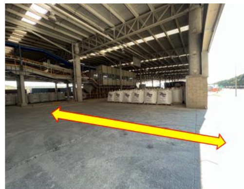
Trayecto de segundo montacargas hacia zona de embarque

Una vez que el montacargas traslada la bolsa al área de almacén temporal, un segundo montacargas lo desplaza hacia la zona de almacenamiento para posterior carga, ya que no existe una rampa que permita ingresar a la zona de embarque.